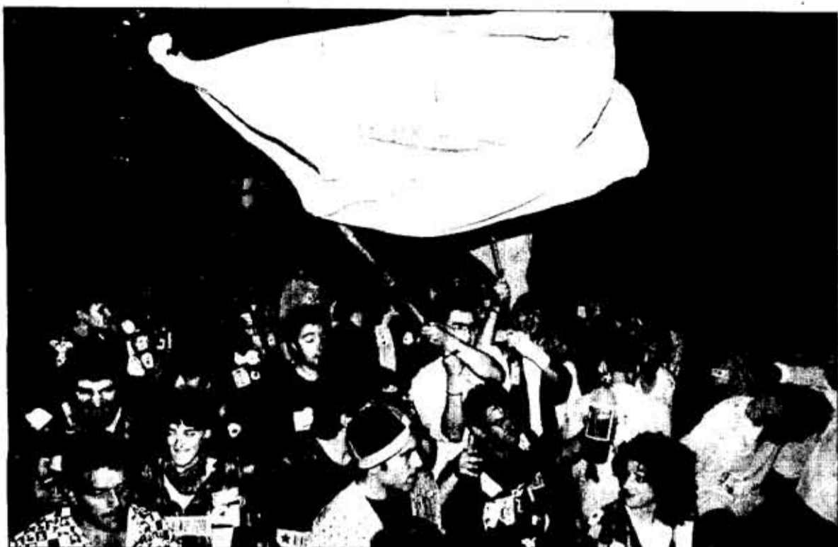
En "Porrontxo Jaiak" participan medio centenar de cuadrillas que agrupan a más de un millar de personas. ANDONI