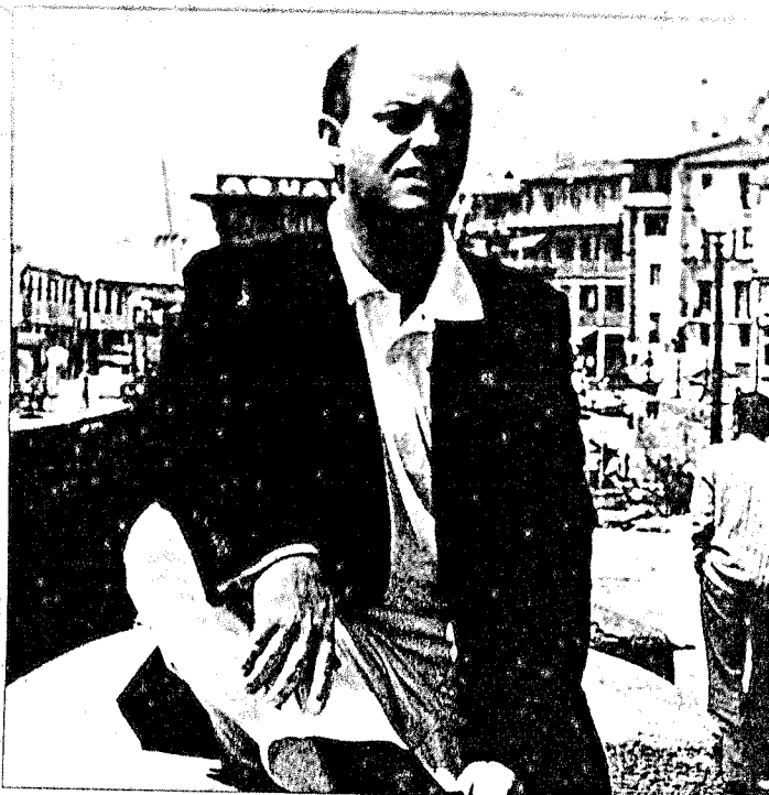
Odón Elorza, alcalde de Donostia

Este deseo será una realidad bien a finales del año en curso o a principios del 94. Será entonces cuando se pongan en marcha las subinspecciones que la Policía Vasca construye en Amara, en la Parte Vieja y en el Antiguo (Ondarreta).