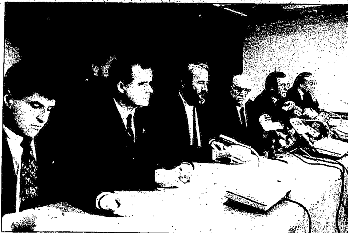
Los partidos democráticos y el diputado general denunciaron los «métodos antidemocráticos» de HB en su política «coincidente» con ETA de socavar la democracia. (Foto Unciti).

Los partidos han decidido, asimismo, proponer a sus representantes en las Juntas Generales, la retirada de la asignación económica que corresponde al grupo juntero de HB y que asciende, aproximadamente, a 20 millones de pesetas, destinando esta canti-