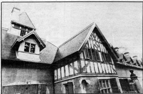
Una parte de los pabellones está aún sin restaurar.