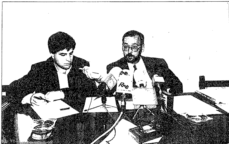
El presidente del PP de Gipuzkoa, Gregorio Ordóñez y el juntero José Eugenio Azpiroz, criticaron la actuación del Organo de Armonización Fiscal de Euskadi.

Ante la campaña de la declaración de la renta que se inicia el 2 de abril, el PP ha presentado una serie de enmiendas al proyecto de norma sobre medidas fiscales urgentes elaborado por la Diputación, proponiendo, entre otras medidas, el aumento de las deducciones familiares y por compra de la primera vivienda, en un intento de reducir la presión fiscal, que en este territorio supera en dos puntos la media estatal.