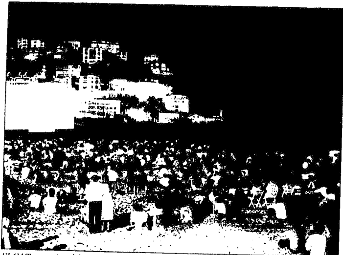
El CAT organizará las sesiones cinematográficas en la plaza de la Trinidad en vez de la playa de Ondarreta.

La playa de La Concha se convertirá por las noches en el gran escenario festivo de la próxima Semana Grande, según los proyectos que prepara el Centro de Atracción y Turismo y que todavía deben ser ratificados por su Junta Rectora. Junto a los festivales nocturnos por la noche frente a la bahía —con grupos como «Alaska» y «Gabinete Caligari»— se cuenta con un órgano acuático de luz y sonido como atracción espectacular para la plaza de Zuloaga. Un 40% del presupuesto de los festejos procederá de un esponsor comercial.