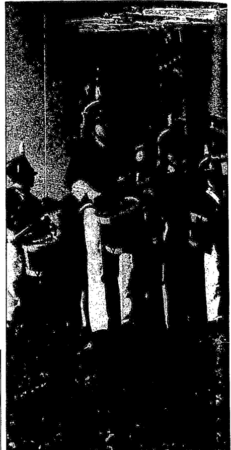
La ayuda de dos entidades privadas realizará este año el espectáculo.

La proyección se complementará con una gran fiesta en la que actuarán los payasos «Hermanos Donosti», un grupo de «majorettes» de Irún, una representación de guiñol y se sortearán, a las siete de la tarde, cien juguetes entre todos los niños que acudan a la fiesta. Para finalizarla, se realizará un gran sorteo sólo para los participantes en la tamborrada, que consistirán en un viaje todavía sin