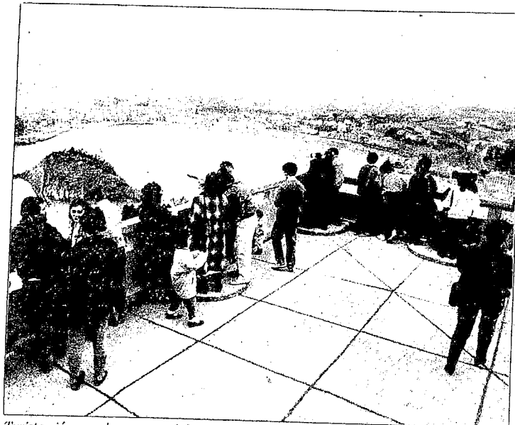
Turistas jóvenes de paso y adultos que pernoctan durante varios días en Donostia recorren durante estas vacaciones la ciudad.