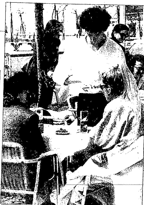
La afluencia de turistas durante las vacaciones de Semana Santa ha saturado las terrazas de gentes de la meseta que buscan unos días de relax al borde del mar.

En junio, por otro lado, tendrá lugar una convención de las ciudades pioneras turísticas europeas, como Venecia, Bari, Brighton o Estoril. «Ofrecemos un turismo personalizado, que disfrute de nuestra calidad de vida, de una temperatura agradable, que conozca los restaurantes, la modas, los espectáculos, nuestro casino, el hipódromo, porque el turismo masificado está desprestigiado».