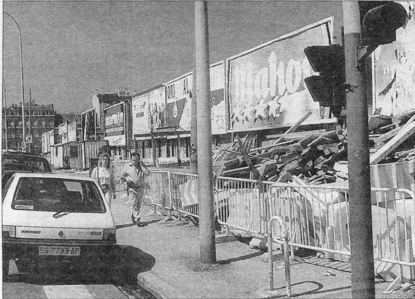
El Kursaal puede volver a tener vallas publicitarias si se adjudica el concurso convocado. POSTIGO

donde cabe la posibilidad de colocar las vallas. También en Sagüés, Duque de Mandas, avenida de Ategorrieta y Venta-Berri puede instalarse publicidad.