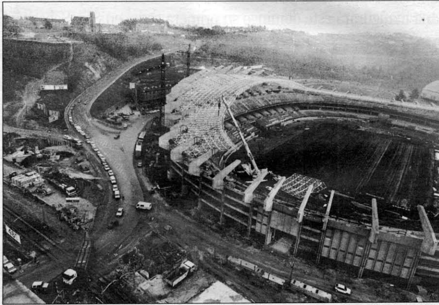
El parking de Illumbe se usaría para las grandes citas del estadio y la hipotética plaza de toros.

El concejal destacó que si el aparcamiento comienza a construirse ahora estará listo para setiembre, ya que se calcula que su construcción dure unos siete meses. Además el aparcamiento se completaría con una pasarela