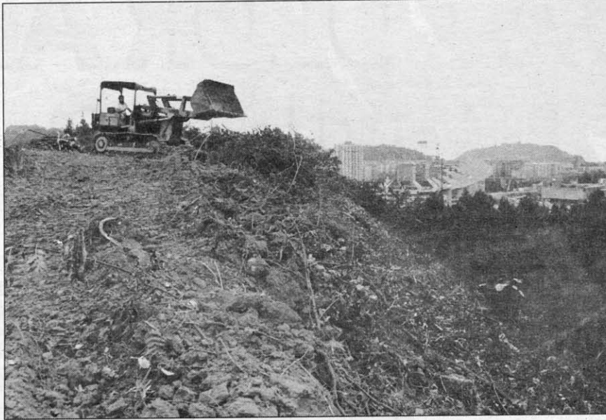
Las máquinas ya han desbrozado el terreno, pese a que comienzan los problemas para el proyecto.