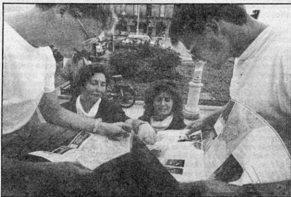
El CAT ha repartido 100.000 mapas a los turistas.