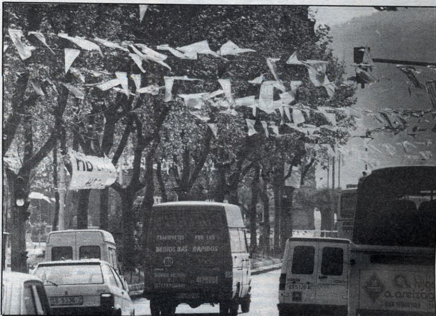
Aunque los banderines ligeros no entran en la normativa, si deberán quitarse pancartas entre los árboles.

también se mostró satisfecho con la medida acordada. «Es algo que habíamos planteado muchas veces y en numerosas ocasiones. Las pancartas en las farolas son algo peligroso y deterioran el mobiliario urbano. De cualquier forma, la medida no afecta solo a la propaganda de los partidos políticos sino también a toda la publicidad estética que se coloca sobre el mobiliario público».