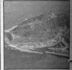
Los lugares más característicos de la ciudad cuentan ahora con su propio folleto explicativo en varios idiomas

cuatro proyectos para hoteles que se encuentran en este momento en cartera. «Durante muchos años no se edificó ninguno ni se crearon nuevas plazas hoteleras. Si ahora se hace es porque se vuelve a conside-