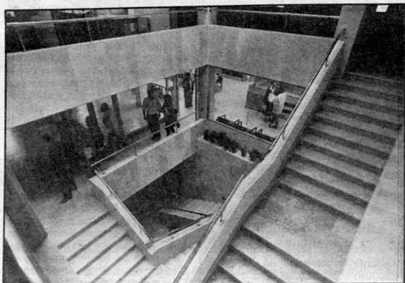
La casa de cultura de Alza, en el caserío Casares, fue la primera que empezó a funcionar en San Sebastián.