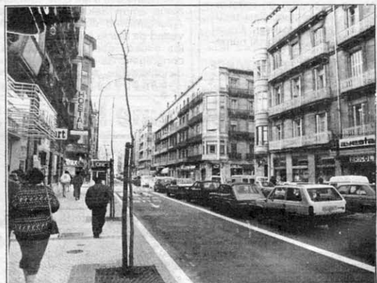
Retoños en Urbietta. Han sido plantados en la calle Urbietta los retoños para los que se había reservado un cuadrado de tierra entre las baldosas. La ampliación de las aceras, tras la remodelación de la calle, supuso la petición de que se colocaran árboles para compensar el intenso tráfico. La sugerencia se aceptó y esta semana se han ido plantando.

Y en nuestra Administración, para las Monjas Contemplativas, 500 pesetas de V.L.