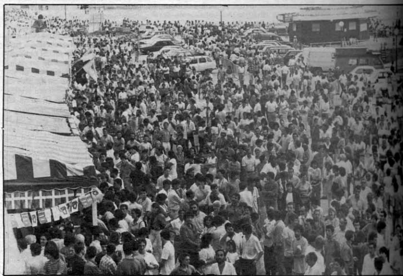
En los últimos años el puerto fue escenario de las «txoznas» y actos de la Comisión Popular de Fiestas.

Una de las principales novedades que se pretende introducir en la presente edición es la colocación en la playa de la Concha de una gran plataforma sobre ralles en la que se ofrecerían diversos espectáculos musicales. Sin embargo, este punto está pendiente de las conversaciones que se siguen con Renfe —empresa que patrocinaba el proyecto— y de los obstáculos que se interponen para su realización. Aun en el supuesto de que la plataforma no se instalara, si habría espectácu-