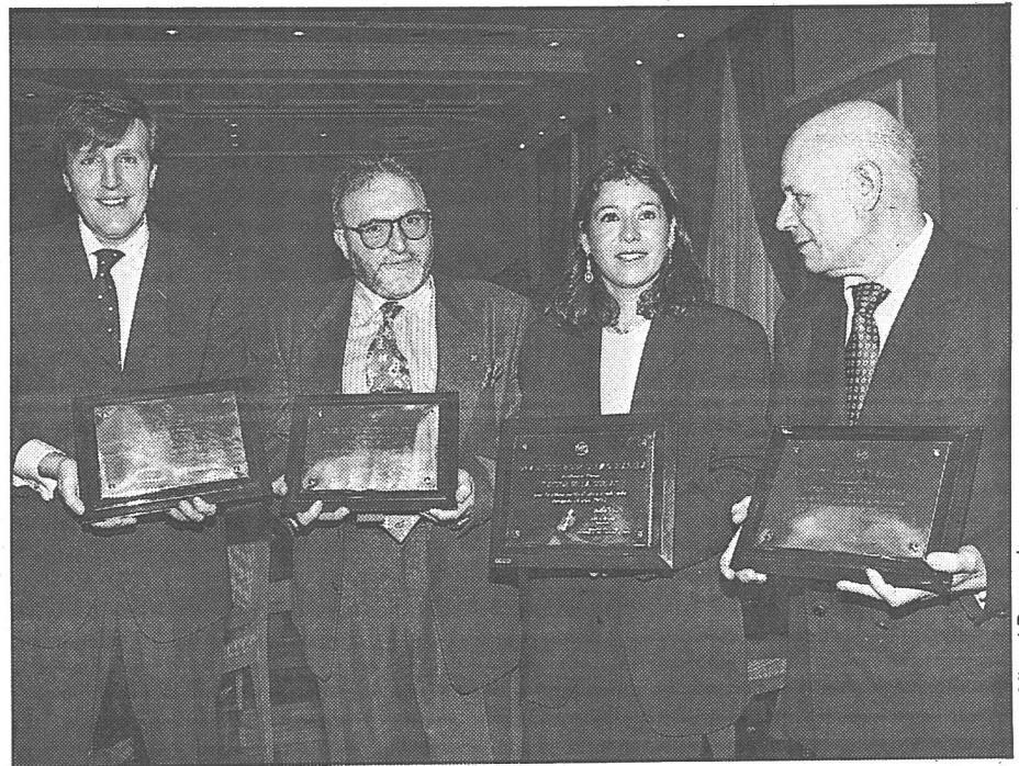
Extra: Miraval Boverocel