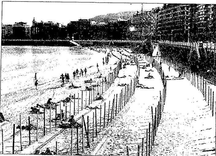
Este año se ha adelantado en más de quince días la colocación de los palos de los toldos.

En el área de ingeniería de playas serán tratados algunos temas de ordenación del litoral y de interacción