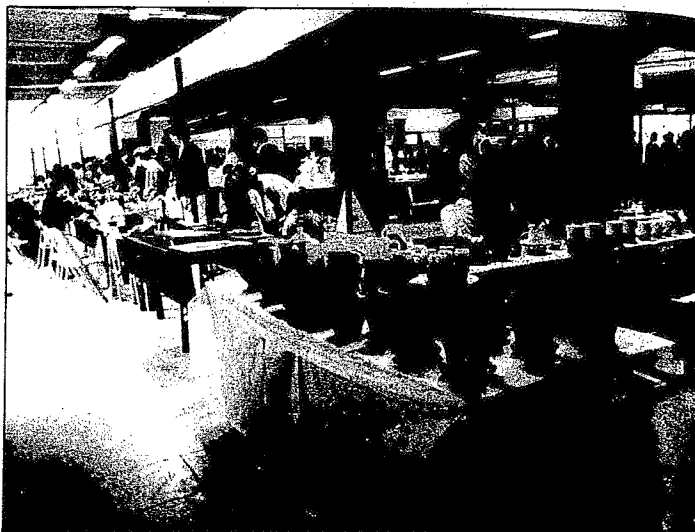
Todo lo relacionado con la artesanía centrará los concursos fotográficos.

Para las mismas fechas, se abre el «I Concurso de Artesanía para escolares». Podrán participar los menores de 7 años (infantiles), de 7 a 14 años (juveniles) y de 14 años en adelante (seniors).