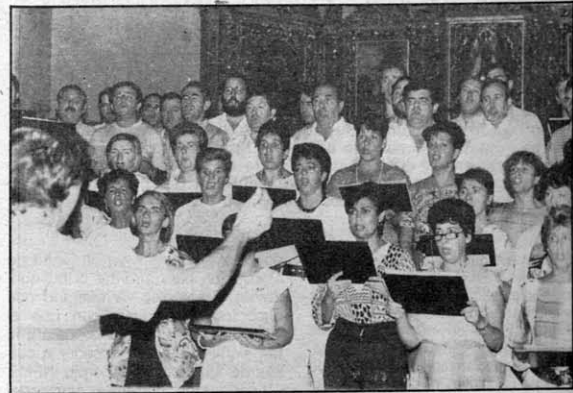
Coral Sostoa que actuará hoy en la parroquia de Ayete.

La Coral Sostoa de Eibar surgió en 1983. Compuesta por cerca de setenta miembros ha tratado de recuperar la actividad coral que se encontraba en claro retroceso en la localidad arquera con el fin de potenciar el hecho musical y su acercamiento a la vida cotidiana. Tras va-