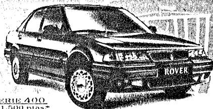
ROVER SERIE 400 Desde 2.151.500 ptas*

ROVER SERIE 200 Y 400 Le prometemos que por mucho calor que haga, nunca le faltará el aire.