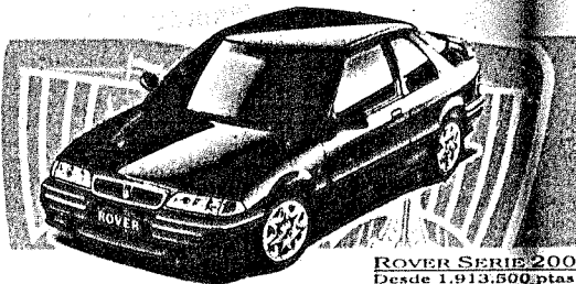
ROVER SERIE 200 Desde 1.913.500 ptas*

Aire acondicionado de regalo en los Rover 200 y Rover 400*.