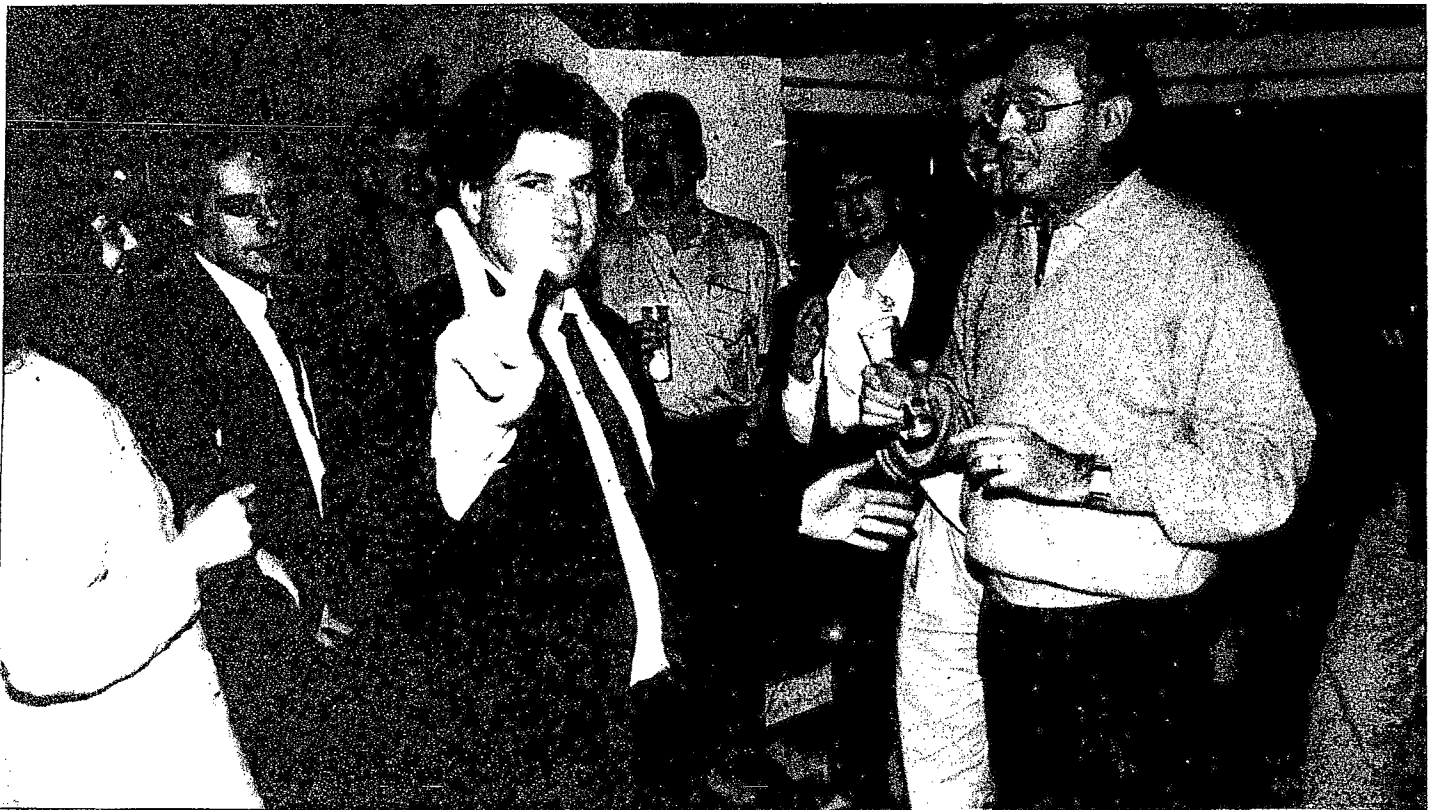
Los candidatos gipuzkoanos del PP vivieron momentos eufóricos tras conocerse el importante ascenso de la formación conservadora en Donostia.

Herri Batasuna, a pesar de perder votos, mantiene su posición como fuerza más votada en este territorio