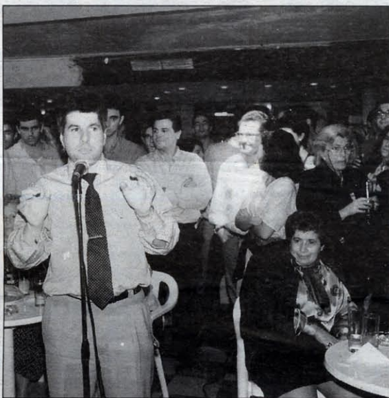
La Rotonda reunió a los líderes del PP./USOZ