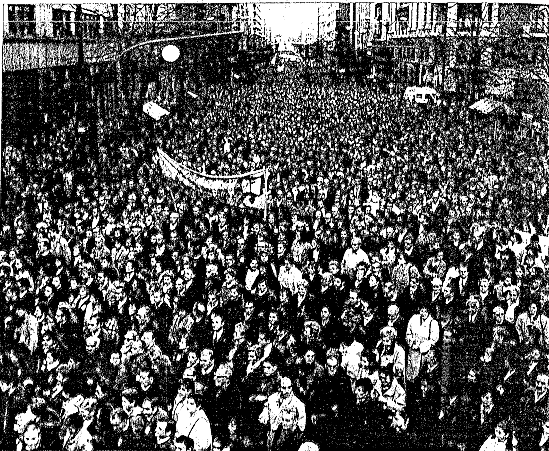
La manifestación de ayer congregó a decenas de miles de personas. Abajo, Mayor Oreja abraza a su hija

Tras recordar el asesinato, expresaron que la sociedad vasca «les ha manifestado una y mil veces su repugnancia por sus métodos asesinos».