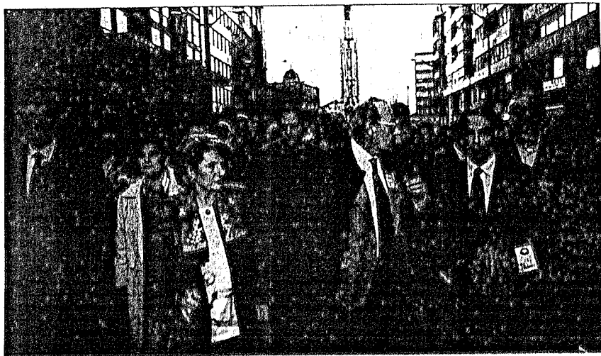
Ardanza estuvo acompañado por su esposa y varios miembros del Gobierno vasco

En este contexto, recordó la figura del ya ex dirigente del PP y subrayó que en la cita de ayer se recuerda «la pérdida de la vida de una persona elegida democráticamente y eso es algo muy sagrado».