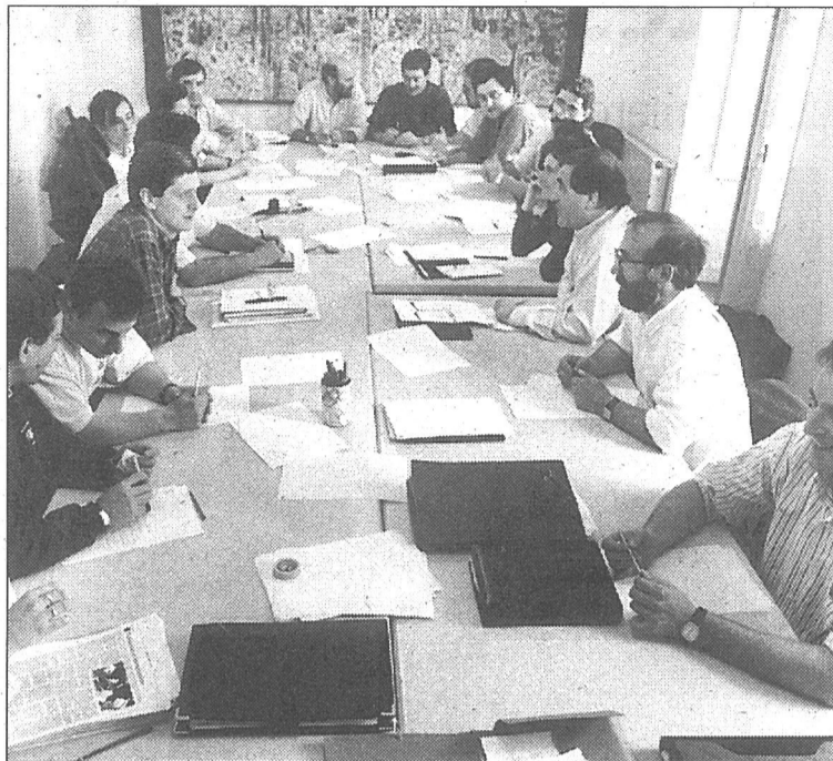
Una reunión de la Mesa Nacional de HB./MIKEL

Herri Batasuna indica que lo que agrupa a su base social es «el proyecto político basado en la defensa de los derechos democráticos, en el objetivo de la soberanía política y en la búsqueda de vías de diálogo y negociación para la resolución de la actual situación