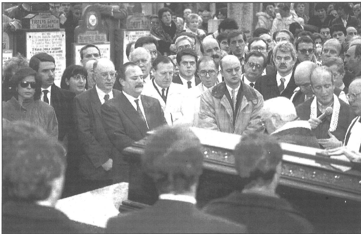
Imagen del entierro del presidente del PP en Guipúzcoa.

"Quiero también hacer una vez más una grave llamada a ETA a fin de que preste a este pueblo, por cuya libertad dice luchar, el mayor y el mejor servicio que le puede hacer: que es el de dejar las armas y abrir así las vías adecuadas para lograr la paz por el camino del mutuo entendimiento", dijo.