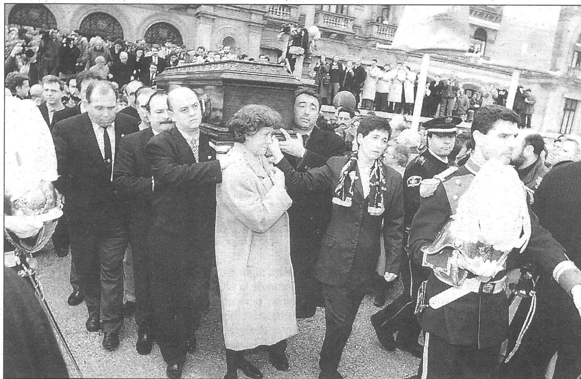
El alcalde y los concejales del PP encabezan el traslado del féretro a la salida del Ayuntamiento.