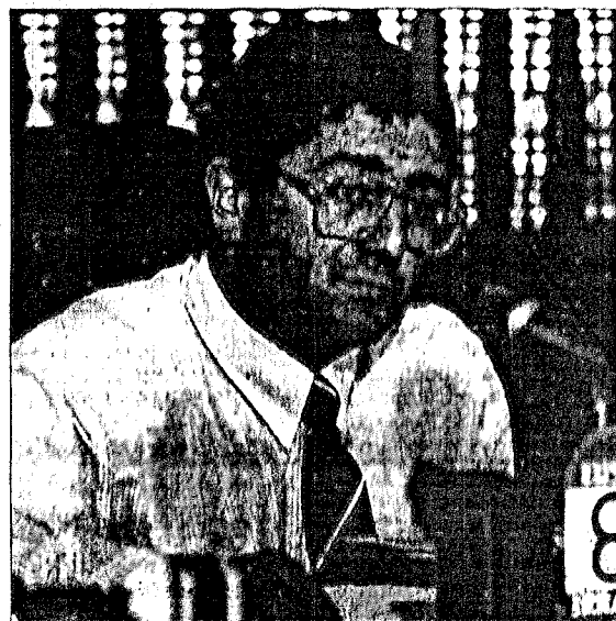
Montero ve en el atentado una manera de ETA para decir «aquí estamos»

La imposibilidad de que muchos de sus militantes puedan expresarse hace, a su juicio, que las voces discrepantes opten por marcharse silenciosamente. «Donde no hay voz, el mecanismo es la salida silenciosa, y eso es lo que vamos a observar en los próximos meses. No va a haber tanto enarbolar facciones, porque hacer un grupo de