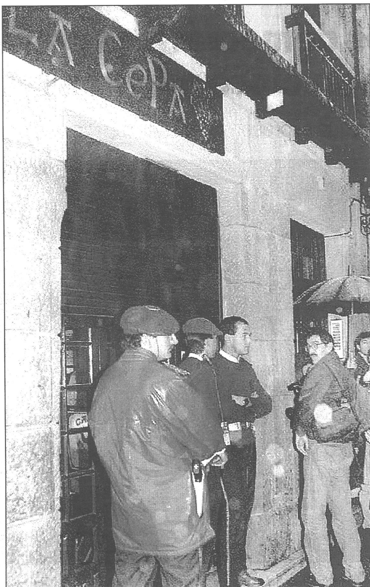
Fachada del bar La Cepa, en la Parte Vieja de San Sebastián.

La clase política catalana testimonió también su pesar por el atentado mortal de San Sebastián. El presidente de la Generalitat, Jordi Pujol, apreció en esta acción terrorista «una carga especial de intencionalidad desestabilizadora, por la forma decidida y valiente con que Ordóñez se había enfrentado al terrorismo». Pujol pidió a la sociedad «que no se deje desmoralizar por este mal colectivo».