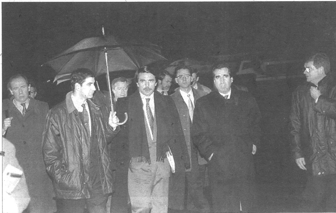
Aznar, acompañado de los dirigentes del PP, fue recibido en Sondika por el gobernador civil.