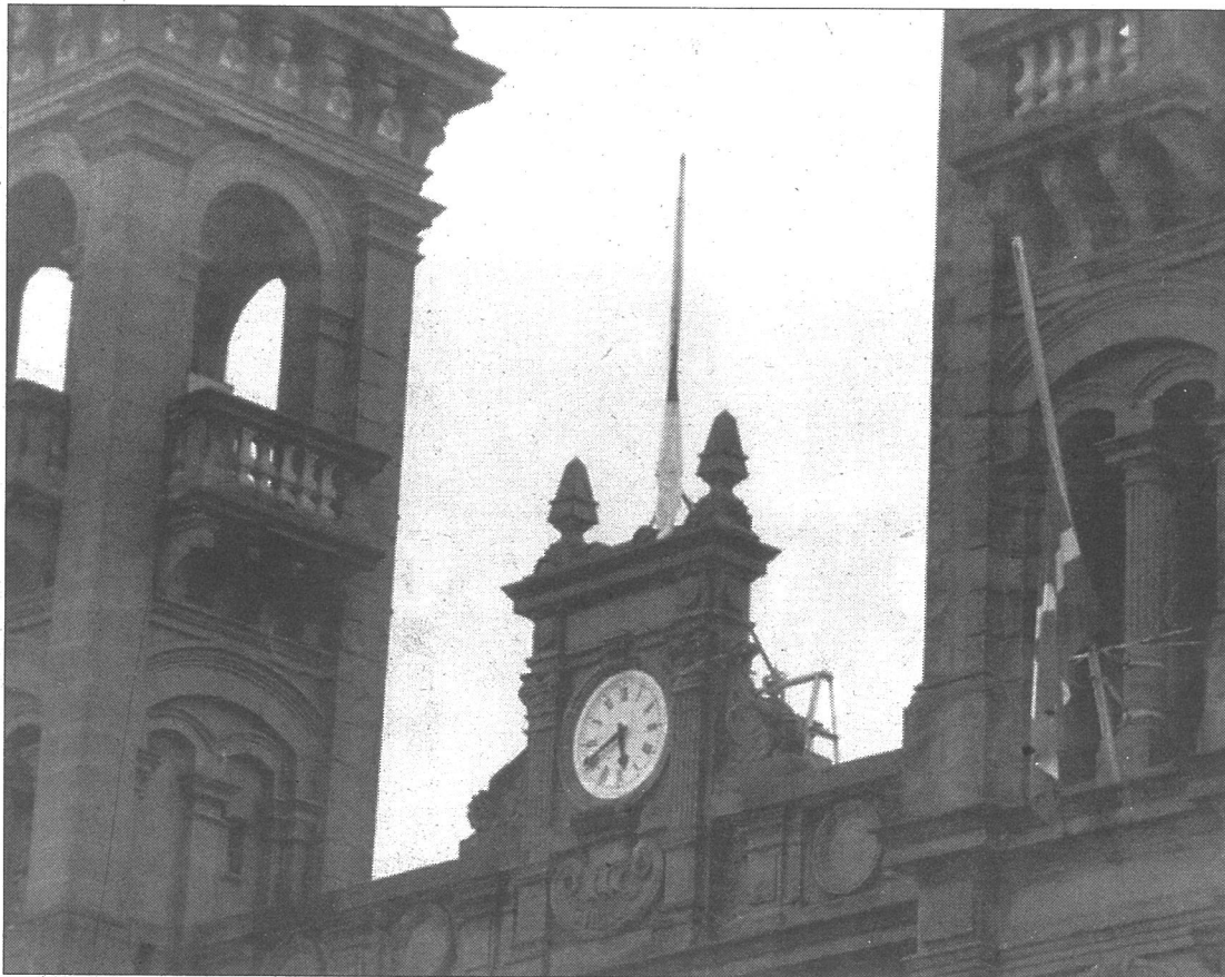
Las banderas del Ayuntamiento de Donostia ondearon ayer a media asta, en homenaje a Gregorio Ordóñez

El líder de Izquierda Unida, Julio Anguita, dirigió un telegrama al presidente del PP, José María Aznar, en el que, además de expresar su consternación por la muerte